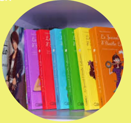
Trousses et collection d'albums