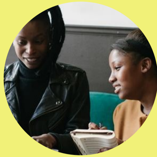
Accompagnement individuel (mentorat)