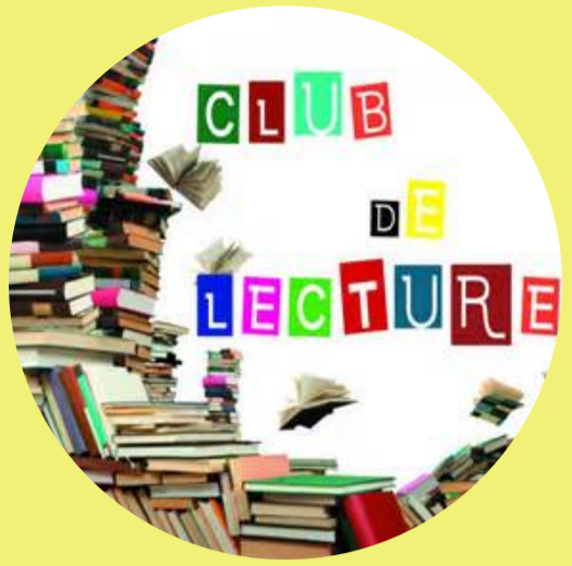
Clubs de lecture et cercles littéraires