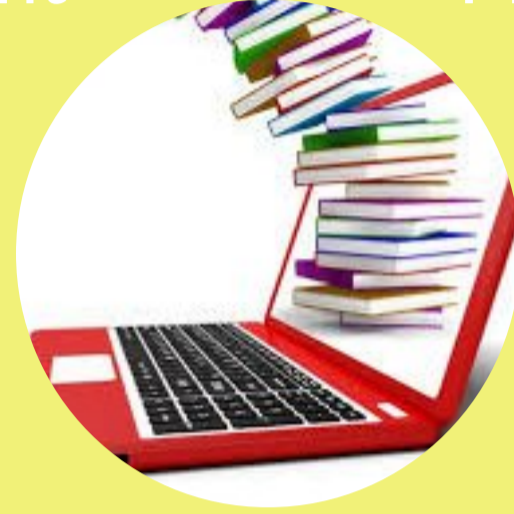
Espaces virtuels dédiés à la lecture