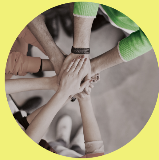
Projets menés par les jeunes