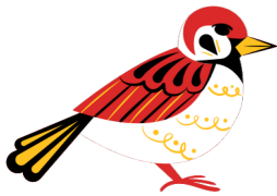
Un oiseau rouge

Regarde bien autour de toi et encercle ce que tu trouves dans le village!