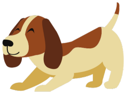
Un chien heureux