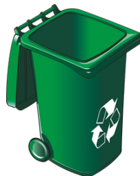
Un bac vert